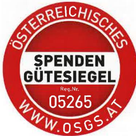
10 Spendengütesiegel BSVOÖ

Zur Erlangung des Spendengütesiegels ist unter Zugrundelegung des Kooperationsvertrages 2005, in der Fassung der Evaluierung 2022, gültig ab 01.04.2023, abgeschlossen zwischen der Kammer und der Wirtschaftstreuhandler und verschiedenen Dachverbänden von Non-Profit Organisationen, eine Prüfung von einem Wirtschaftstreuhandler durchzuführen.