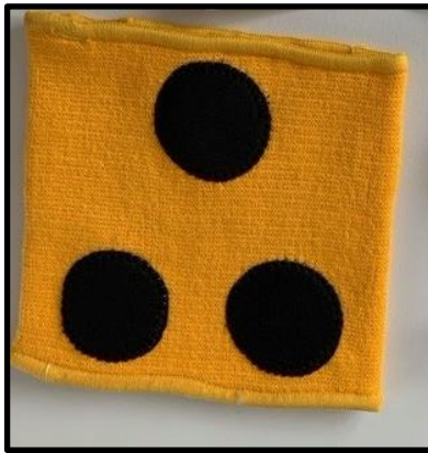
Blindenarmschleife gelb mit 3 schwarzen Punkten

Viele davon werden in unserem Haus angeboten. Gerne beraten wir Sie, führen Ihnen unsere Produkte vor und lassen Sie die verschiedenen Artikel ausprobieren. Jeder Gegenstand steht zum Test und zum „Begreifen“ zur Verfügung. Sollte ein Artikel nicht vorrätig sein, bemühen wir uns um eine Lösung.