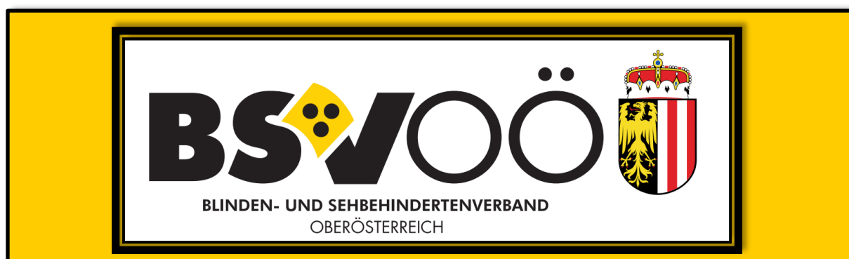
Logo vom BSVOÖ und Landeswappen OÖ