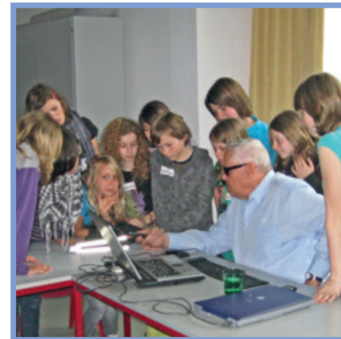
Öffentlichkeitsarbeit des OÖBSV