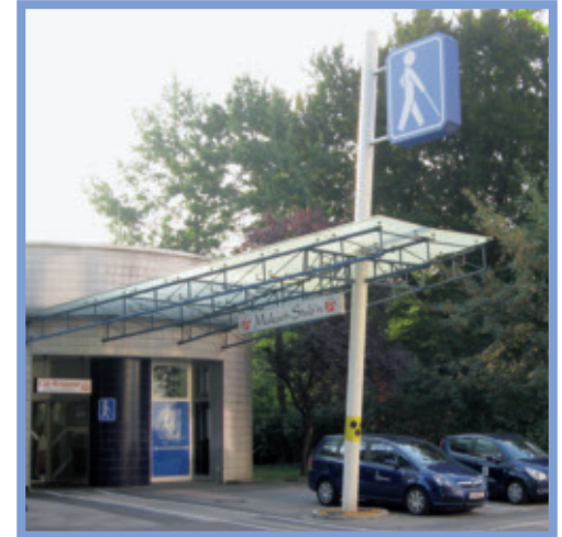
Das Haus des OÖBSV in der Makartstraße 11, 4020 Linz