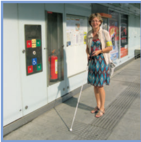
Fahrgastdynamische Anzeigen bei den Haltestellen